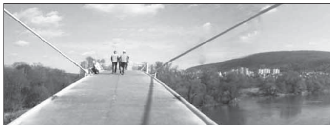
Cyklomost stav prác na konci marca 2012.