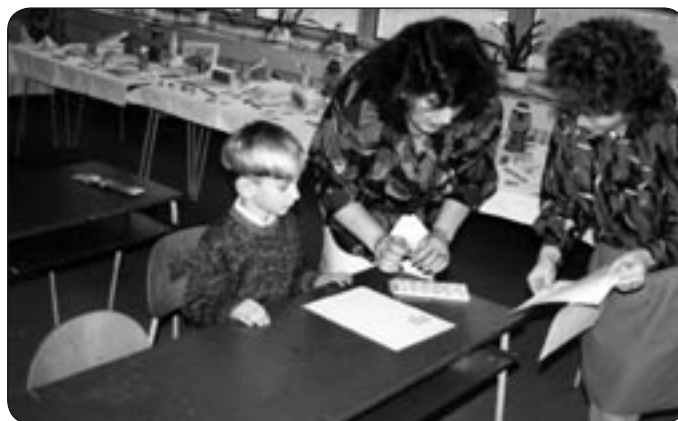
Pre budúcich prváčikov prichádza deň zápisu do školy

V čísle: ① Zápis do 1. ročníka ZŠ ② Z radnice * Prečo? ③ Čo občanov zaujíma ④ Kultúra ⑤ Spoločenská kronika ⑥ Slovo Novovešťanov ⑦ Inzercia ⑧ Z policajného zápisníka