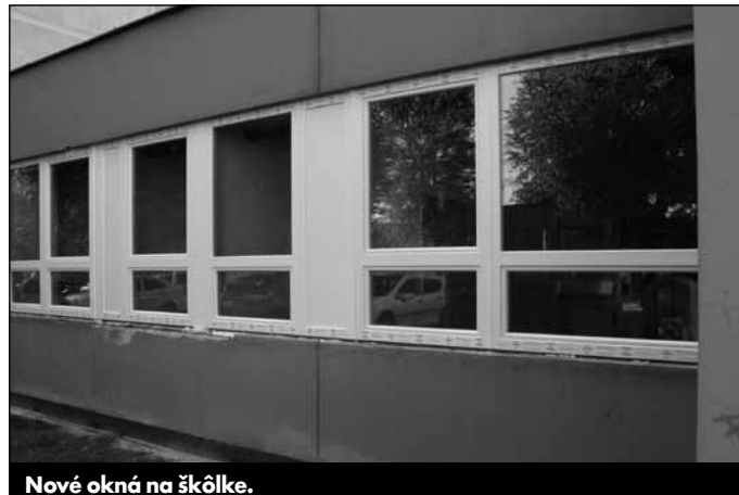
Nové okná na škôlke.