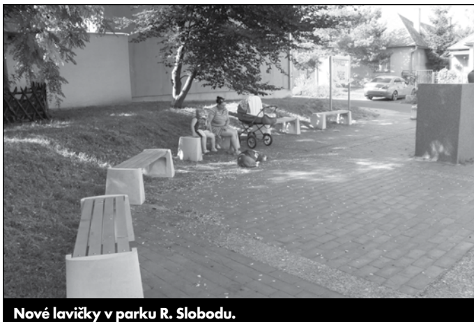
Nové lavičky v parku R. Slobodu.

Záujemcovia, ktorí sa chcú dozvedieť viac odporúčame navštíviť internetovú stránku: www.tokarstvo.info