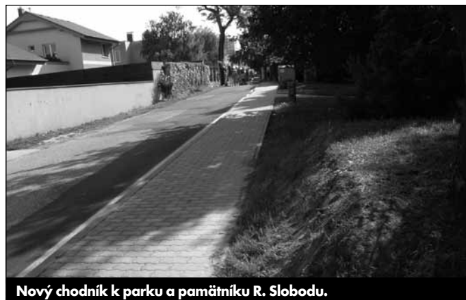
Nový chodník k parku a pamätníku R. Slobodu.

Tých realizovaných vecí je samozrejme viac. Nepatrí sa hodnotiť vlastnú prácu, ale jedno hodnotenie si predsa len neodpustím. Myslím, že len doteraz sa nám podarilo spraviť viac, ako predchádzajúcej garnitúre za 4 roky. Združenie Devínska Inak (ktoré chce všetko inak, ale nikto nevie ako, ja si myslím, že nijak) nám v našom úsilí vôbec nepomáha, skôr naopak.