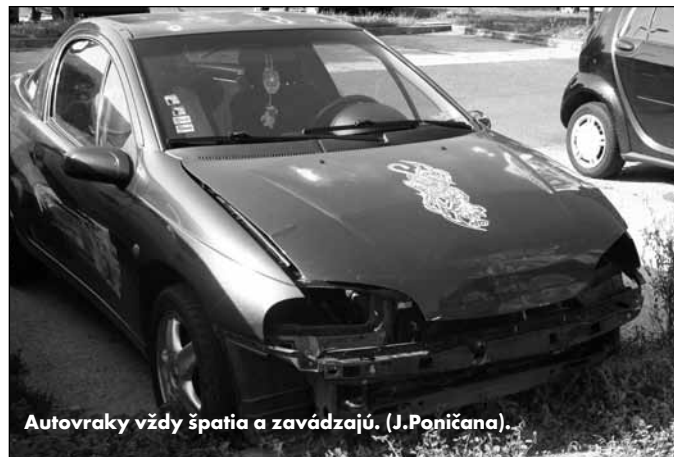
Autovraký vždy špatia a zavádzajú. (J.Paničana).

do nákupného centra Polus City Center na Vajnorskej ulici v Bratislave.