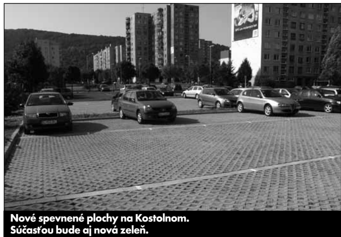
Nové spevnené plochy na Kostolnom. Súčasťou bude aj nová zeleň.