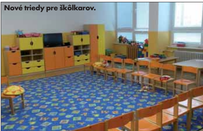
Nové triedy pre škôlkarov.

nás presvedčil, že to bol dobrý nápad. Priniesť kúsok kultúry, zábavy a vianočnej atmosféry aj k nám. Čo najviac spája ľudí, rodiny, či priateľov? No predsa sviatky. Tak vznikla myšlienka zorganizovať vianočné trhy aj u nás v Devínskej Novej Vsi. Nechceli sme zostať len pri nízkorozpočtovom (Pokračovanie na strane 9)