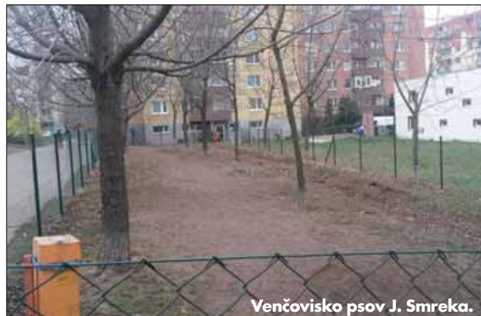
Venčoviško psov J. Smreka.

nám získať dotáciu z Úradu vlády na športové potreby pre našich mladých futbalistov, hokejbalistov a stolných tenistov. Veľkou chvíľou bolo pre mňa aj otvorenie expozície Múzea starej Devínskej. Bez prehánania si dovoľím tvrdiť, že takéto krásne múzeum má málokterá mestská časť Bratislavy. Rozšírením priestorov v našej De-