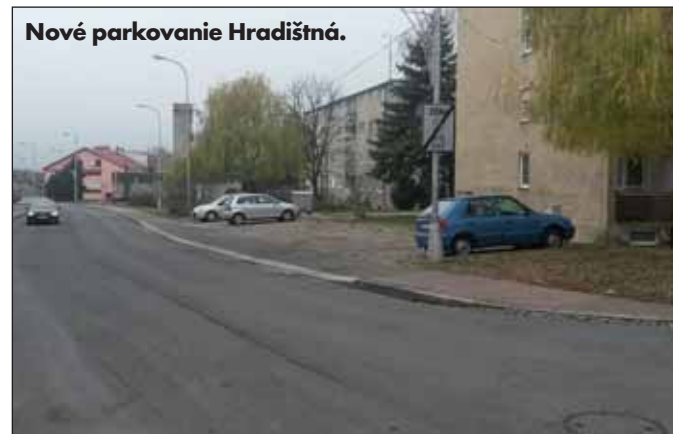
Nové parkovanie Hradištná.