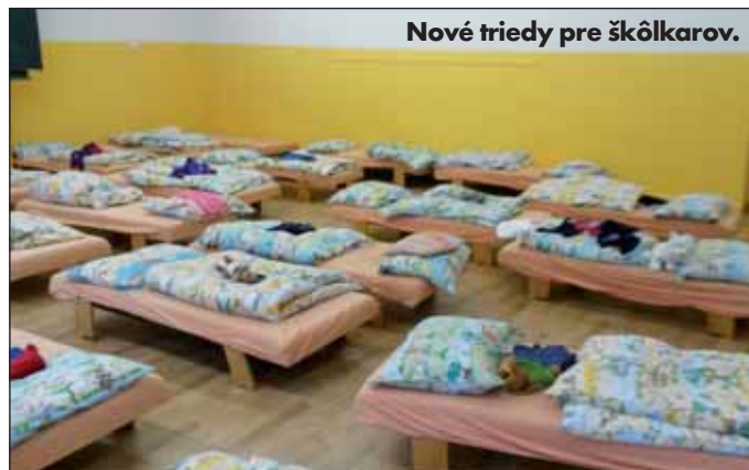
Nové triedy pre škôlkarov.

realizovali sme tento rok podobný priestor pre psíčkarov aj na ul. J. Smreka. Nezabudli sme ani na šport, podarilo sa nám vytvoriť zázemie v športovom areáli na ZŠ P. Horova.