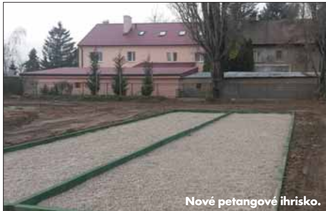
Nové petangové ihrisko.

podujatí s krátkym programom a zopár stánkami. Na "skúšku" sme ponúkli Devínskej Novej Vsi a jej občanom plnohodnotné, kvalitné a úplne nové podujatie Vianočná ulička na Hradištnej ulici. Vianočné trhy s novou myšlienkou na novom mieste a v novom štáte, si podmanili svojich návštevníkov. Za uplynulé roky sme zažili počas podujatia rôzne " nálady " počasia, je nám však obrovskou odmenou, že to návštevníkov neodradilo a predsa prišli. Samozrejme sa snažíme každým rokom zlepšiť čo sa dá a čo je v našich silách, tak sme napríklad pre návštevníkov vymysleli dekoračné ohne, ktoré zahrejú na pocit a dodajú jedinečnú atmosféru. Stan, v ktorom si v teple môžete posedieť a s priateľmi si pri stole vychutnať občerstvenie či si len tak oddýchnuť a porozprávať sa. Spokojnosť návštevníkov nás posúva dopredu a preto sa snažíme, aby rok čo rok bola Vianočná ulička lepšia, krajšia a bohatšia. Od roku 2011 je Vianočná ulička neoddeliteľnou súčasťou kultúrnej