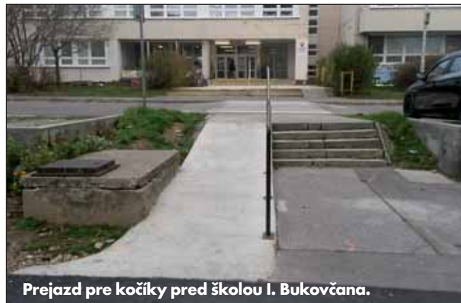
Prejazd pre kočíky pred školou I. Bukovčana.

moch majú najmodernejšie optické pripojenie. Nezabudli sme ani na deti – tak ako vznikali nové detské ihriská, rekonštruovali sme aj tie staré. Máme už aj dve nové petangové ihriská. Po úspechu s výbehom pre psov na ul. I. Bukovčana,