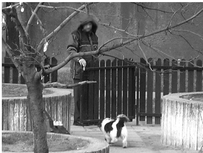
Posielam Vám foto venčenia psa v priestoroch určených pre deti. Na to, že je v priestoroch zakázaný vstup pre psov, milovník detí si otvoril bránku a psa do zakázaného priestoru pustil. Akým spôsobom sa postupovalo k vymáhaniu pokuty za znečisťovanie? pč