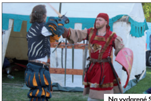
Na vydarené Samove hry zostali iba pekné spomienky :-)